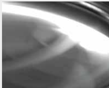
LUCIDATURA rugosità fino a 0,02 μm