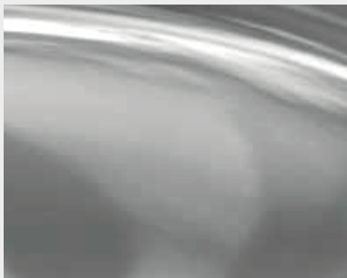
SATINATURA grana fino a 600 o Scotch-Brite™